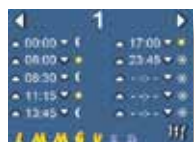
Crono termostato settimanale