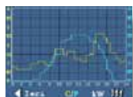
Grafico produzione e consumi