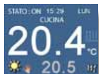
Regolazione temperature zone